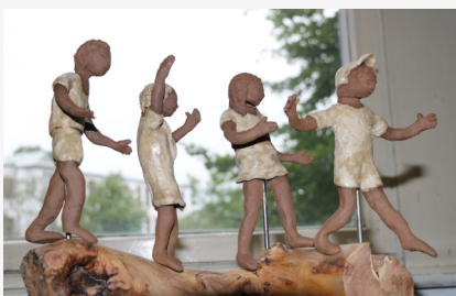
„Über Stock und über Stein“ nennt H. Schödel (Töpen) diese vier Figuren.

Im hintersten Zimmer des obersten Stockwerks: Erstmals Erotika von Harald Richter. Der Raum ist zwar vorsorglich mit der Warnung „Zutritt nur ab 18 Jahren“ versehen, wozu Kunstvereins-Vorsitzender Wittig aber auch grübelt, dass die jungen Leute ja jetzt schon ab 16 Jahren